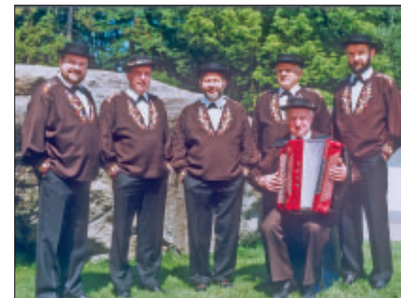
Obwaldner Echo-Jodler, Alpnach

Was immer Ihnen auch passiert, wir helfen Ihnen schnell und unbürokratisch aus der Patsche.